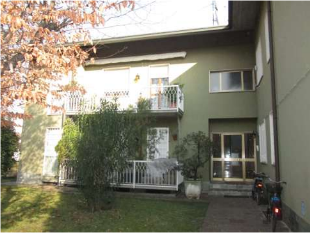
L ingresso comune al fabbricato

Lotto 001 Unità immobiliare in Cernusco sul Naviglio (MI), Via G. Puccini, 2 PT (rialzato)-S1