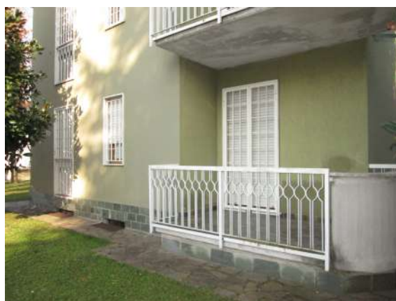
Balcone lato camera con umidità in parete