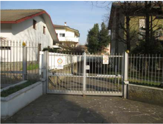
Ingresso carraio piano corpo box