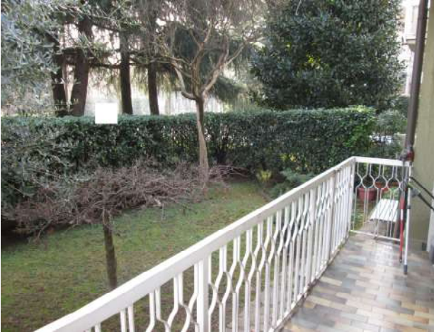
Porzione di balcone