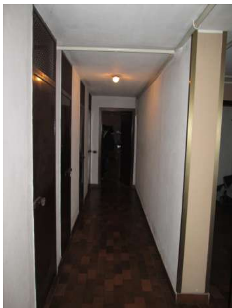
Corridoio cantine piano sem.to