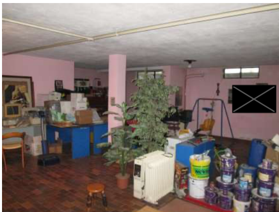
Ripostiglio piano seminterrato