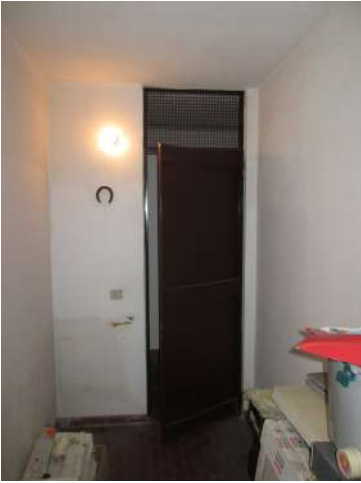
Lotto 001 Unità immobiliare in Cernusco sul Naviglio (MI), Via G. Puccini, SNC , Locale Box/Autorimessa