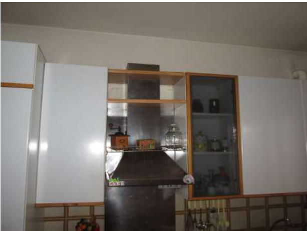
Parete attrezzata, con probabile foro cappa questo da accertare