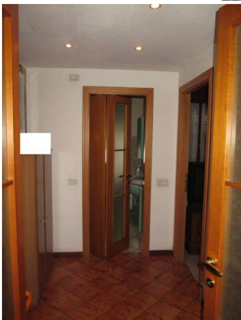
Disimpegno notte con controsoffitto